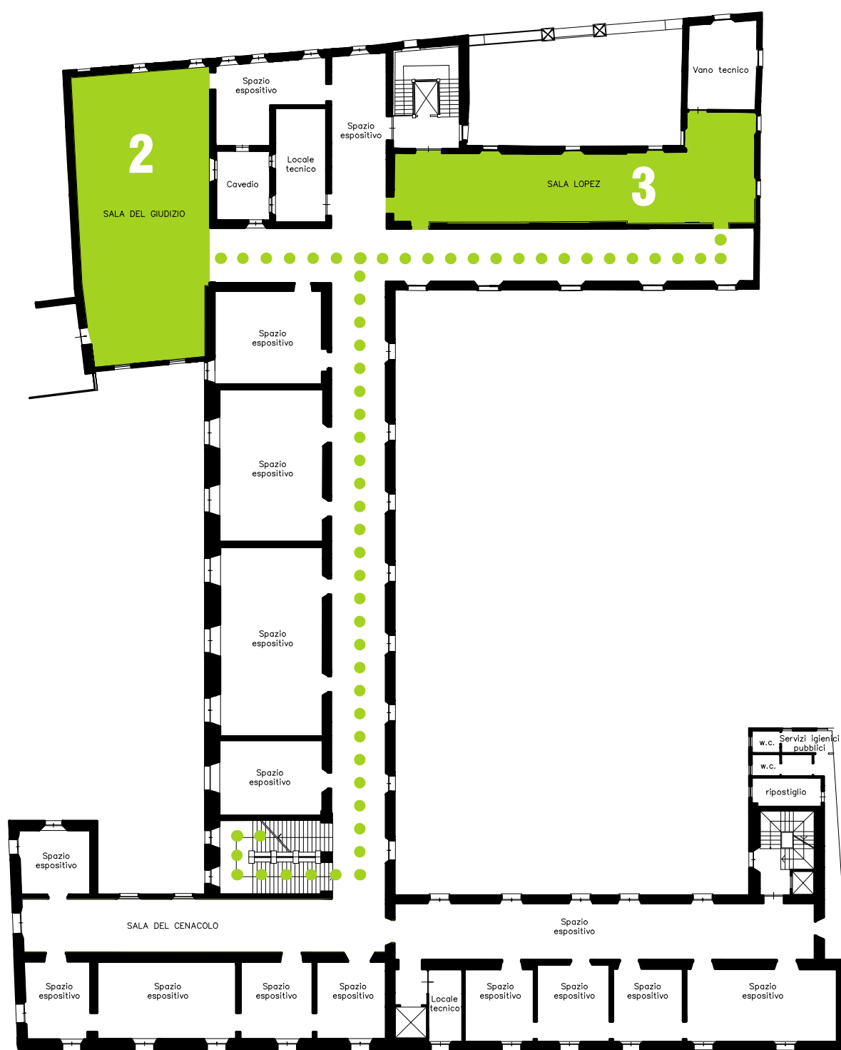
PIANO PRIMO / FIRST FLOOR